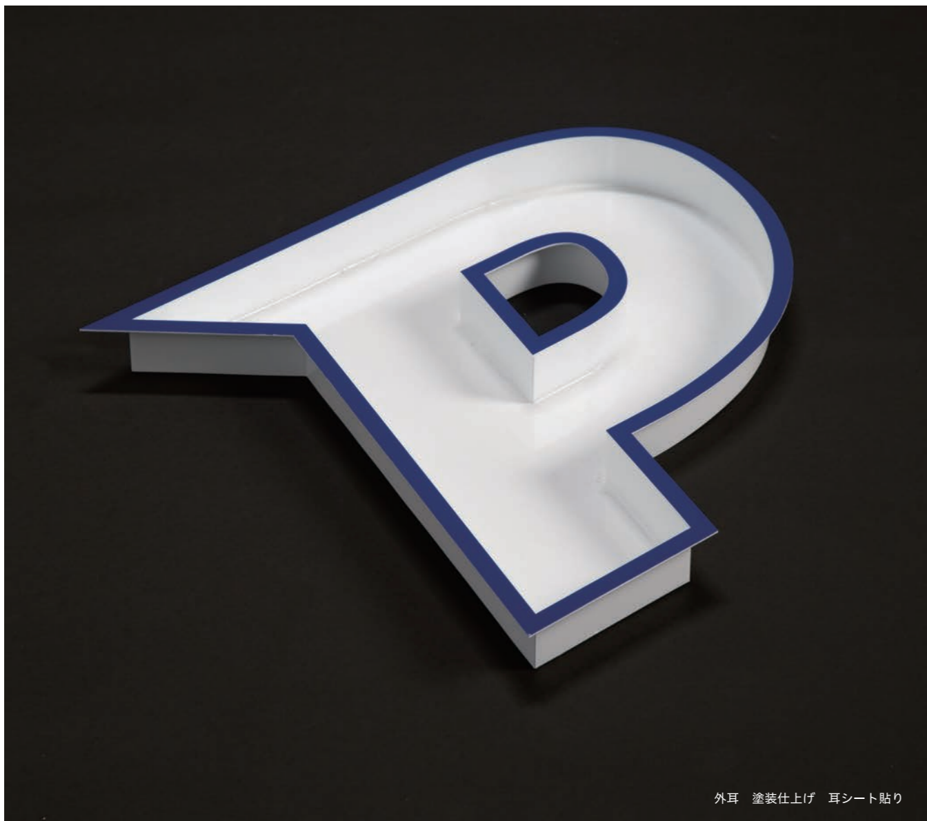
外耳 塗装仕上げ 耳シート貼り